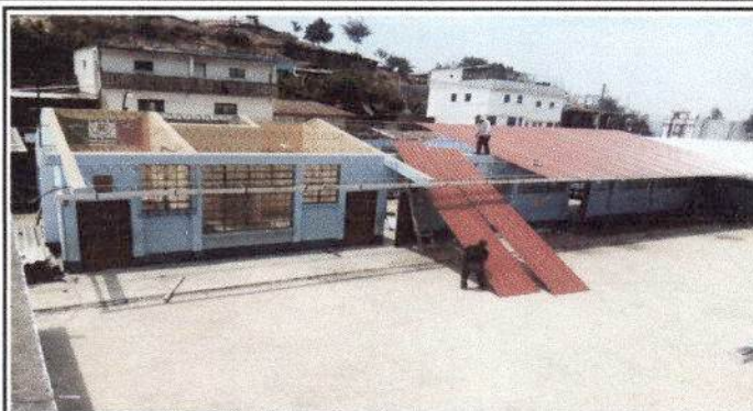
Foto 2: Instalacion de 195.5 metros cuadrados de lamina troquelada calibre 26